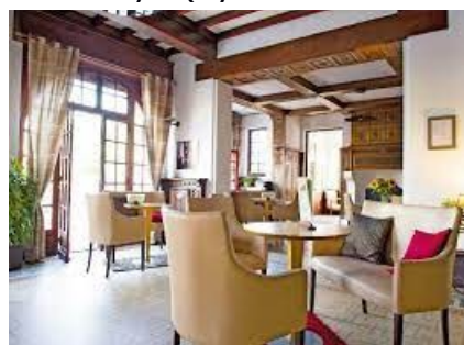
Dîner et nuit