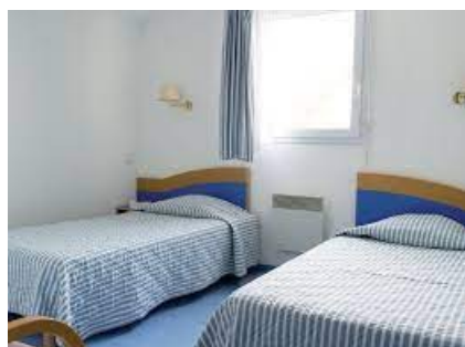
Installation dans les chambres,

Départ très tôt le matin en autocar GT de Pontarlier, Morteau et Besançon . Déjeuner libre en cours de route (possibilité de prévoir un pique-nique). Arrivée en fin d'après-midi à l'hôtel Vacances Bleues « Orhoitza » à Hendaye (Pyrénées Atlantiques)