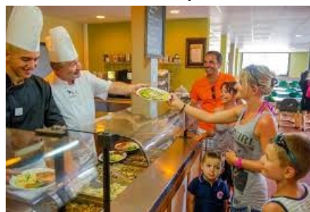
Apéritif de bienvenue. Dîner et nuit